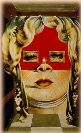
Retrato de Mae West. 1.949