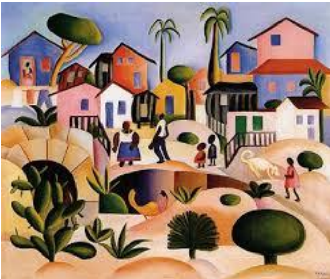
Obra: Morro da Favela