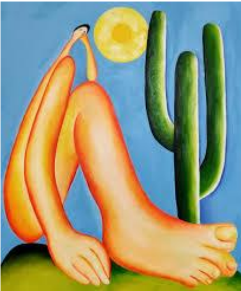
Obra : Abaporu

Exploramos la obra de la artista Tarsila Do Amaral