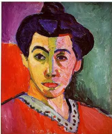
Madame Matisse o La Raya verde

https://www.lacamaradelarte.com/2016/05/la-rama-verde.html